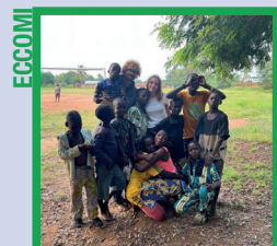
Vi do la mia pace!